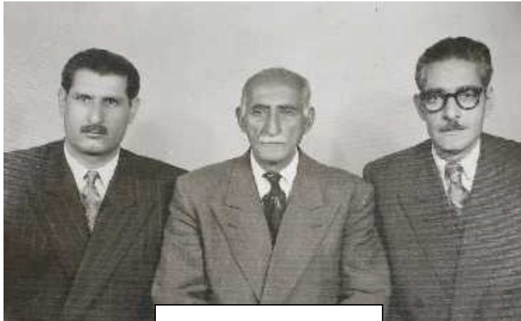
باقرخان در کهنسالی

گذارد. این مجموعه را می توان در دسته های ذیل قرارداد: