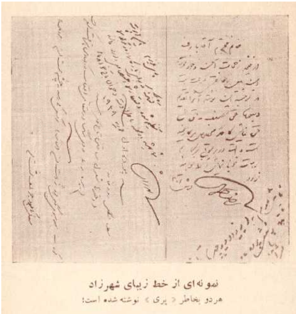
نمونه ای از خط زیبای شهرزاد هر دو بخاطر « پری » نوشته شده است!

"پری عزیزم این اپرت قشنگ که برای یادگار روز تولد شما تنظیم شده و فقط به شما اختصاص دارد. مانند شما همیشه در صحنه با طراوت و جوان باقی خواهد ماند فوریه ۱۹۲۹ امضای شهرزاد"