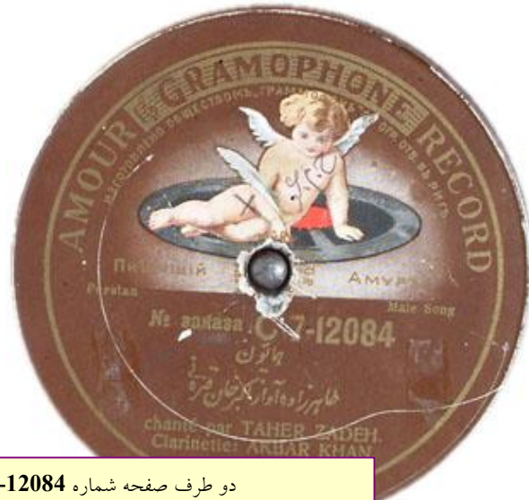
دو طرف صفحه شماره C 7-12084 تولید سال ۱۹۱۵ در روسیه شامل: 7-12084 همایون، طاهرزاده آواز اکبر خان قره نی و 7-16000 رنگ همایون، قره نی (اکبر خان)