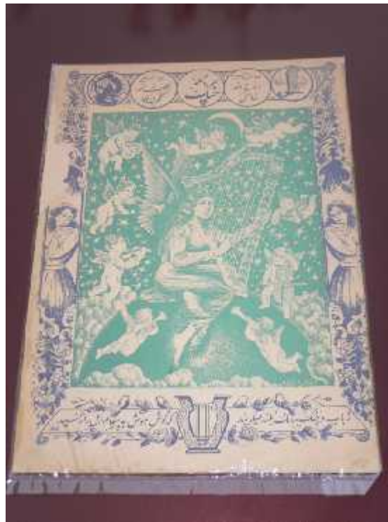
مجله چنگ شماره اول، فروردین ۱۳۲۵ شمسی