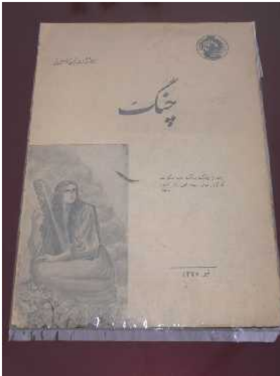
مجله چنگ شماره دوم، تیر ماه ۱۳۲۵ شمسی